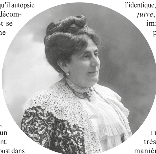
L'un des derniers portraits par Nadar

En même temps qu'il autopsie une société en décomposition, Proust se consacre à une exploration vertigineuse qui le relie à un autre Juif, son contemporain, Freud. Cette part inexplorée de nous-même qui les absorbe l'un et l'autre, Freud lui donne un nom, l'inconscient. La plongée de Proust dans